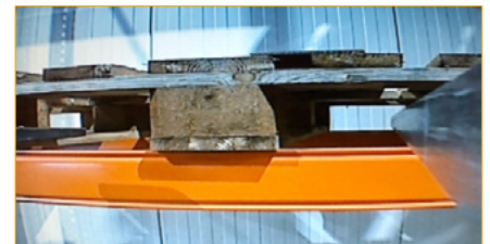
Einfahrt in die Palette mit der GripView.