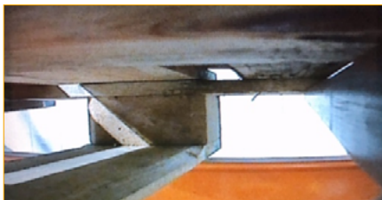
Aufnahme der Palette mit der GripView.