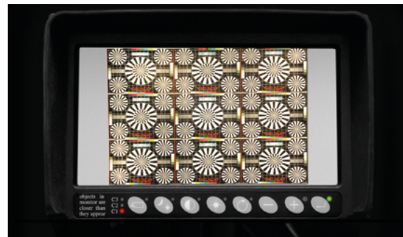
Korrigiert 102° bei Orlaco Kameras