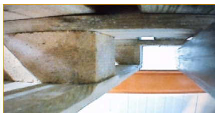
Réception de la palette avec le standard du marché.