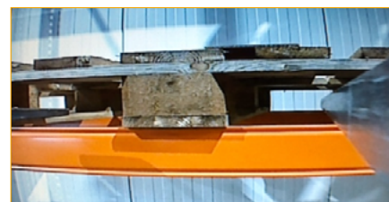
Introduction dans la palette avec GripView.