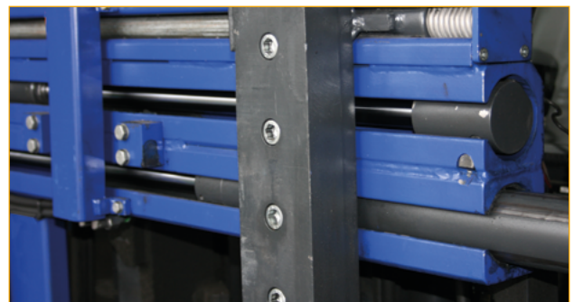
Standaard roestvrijstalen veer